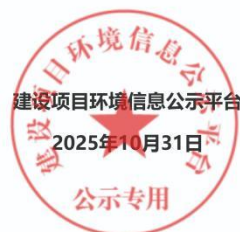
图 1 征求意见稿网络公示截图