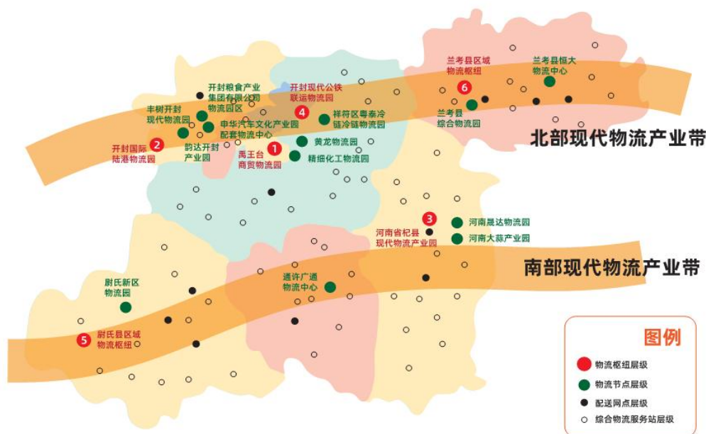
图2 物流基础设施网络体系示意图

合物流服务站的建设，支持各主体之间加强战略联盟、资本合作、设施联通、信息平台对接等，进一步加强与郑州国家物流枢纽以及省内外国家物流枢纽的对接，加快推动区域物流枢纽系统成网运行。